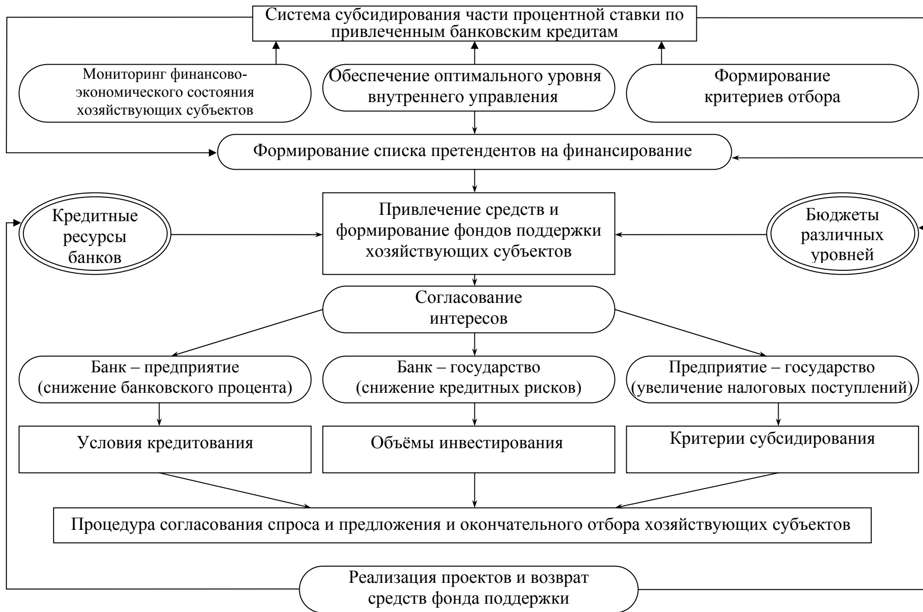
Рисунок 2 – Система субсидирования части процентной ставки, учитывающая интересы всех участников процесса субсидирования (авторская разработка)